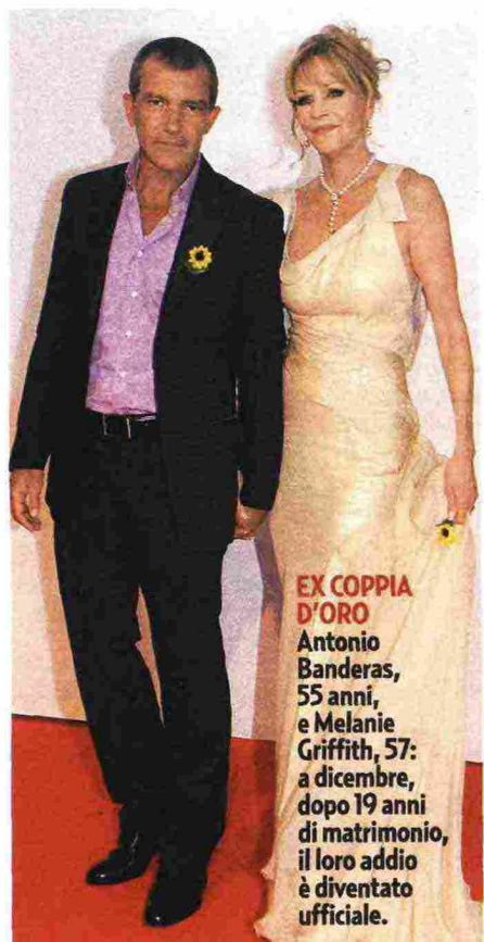
EX COPPIA D'ORO Antonio Banderas, 55 anni, e Melanie Griffith, 57: a dicembre, dopo 19 anni di matrimonio, il loro addio è diventato ufficiale.

16,2% DEGLI ADDII RIGUARDA NOZZE DURATE PIÙ DI 25 ANNI